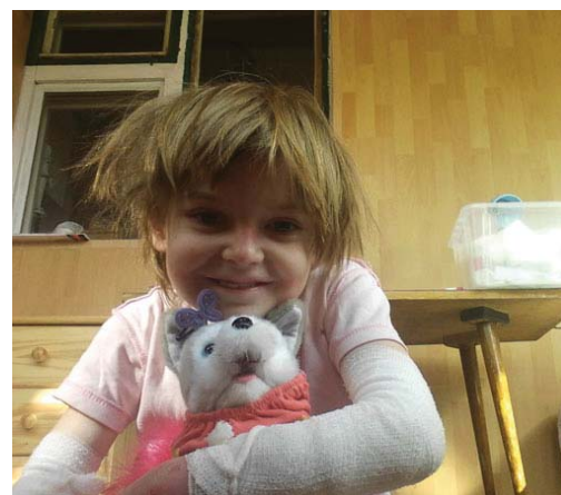
„Strapatá, ale šťastná Motýlia princezná Margarétka - Radosť je niekedy silnejšia ako bolesť.“