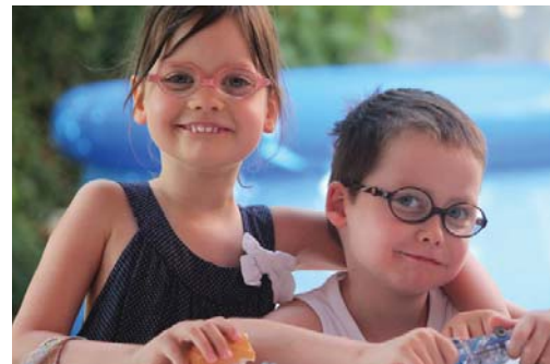
„Svetový unikát, ale nie pre celebrity.“